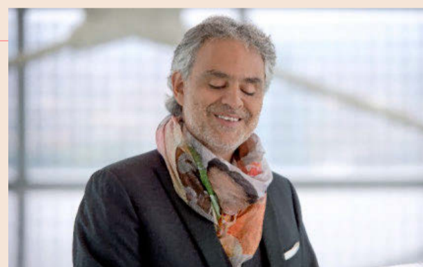
Andrea Bocelli es el artista con más caché del Festival de Cap Roig.

El pop marca la edición de este año, con Sting –antiguo cantante de The Police–, James Blunt, Hombres G, Loquillo, Macaco, Maná y el intérprete de Supertramp Roger Hodgson. Abrirá el ciclo Luis Miguel, y lo cerrará Andrea Bocelli.