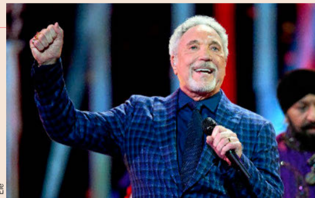
El cantante británico Tom Jones actuará en Jardins de Pedralbes.

Este año, el Jardins de Pedralbes ha apostado principalmente por el funk y el jazz en un festival cuya voz más destacada es la del británico Tom Jones. The Jacksons, antigua banda de Michael Jackson, es la otra actuación más esperada.