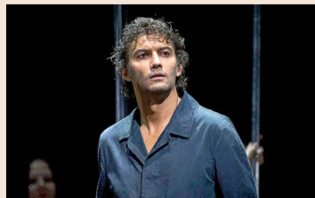
Peralada acogerá la actuación del tenor alemán Jonas Kaufmann.

El tenor alemán Jonas Kaufmann es la principal actuación de un festival que mantiene la ópera y la música clásica como principales reclamos. También habrá hueco para el ritmo latino del guitarrista mexicano Carlos Santana y su banda.